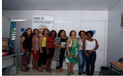
Team van het sociaal wijkcentrum