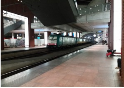
Station in Antwerpen