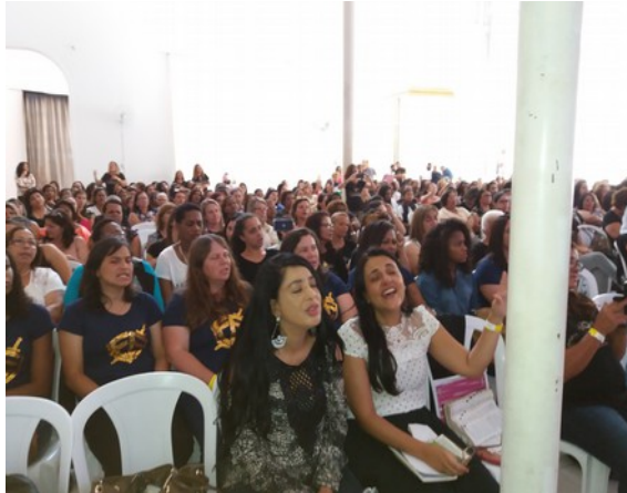
De vrouwenconferentie in Petropolis